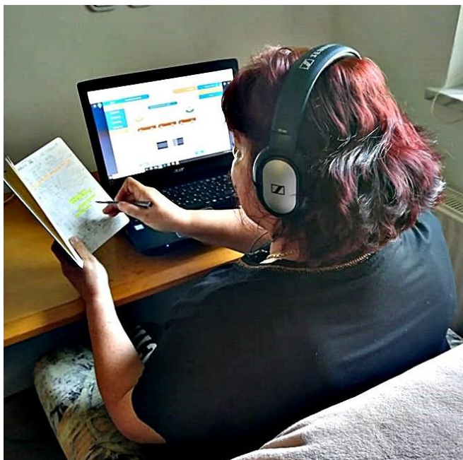
Učenje angleščine preko spleta.

Projekt je del Študentskih inovativnih projektov za družbeno korist (ŠIPK), kjer se medsebojno povezujemo visokošolski zavodi z negospodarskimi organizacijami. Naša skupina se povezuje s centrom dnevnih aktivnosti za starejše občane v Kopru. Smo skupina študentk in študentov Filozofske fakultete, Fakultete za računalništvo in informatiko in Akademije za likovno umetnost in oblikovanje Univerze v Ljubljani. Projekt sofinancirata Republika Slovenija in Evropska unija iz Evropskega socialnega sklada.